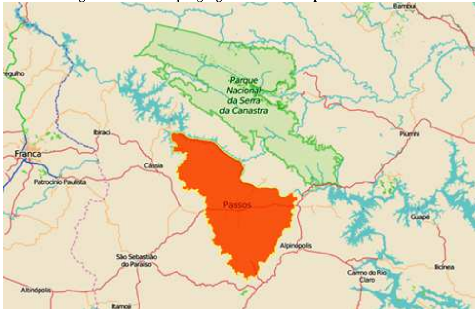
Figura 1 – Localização geográfica do município de Passos MG.